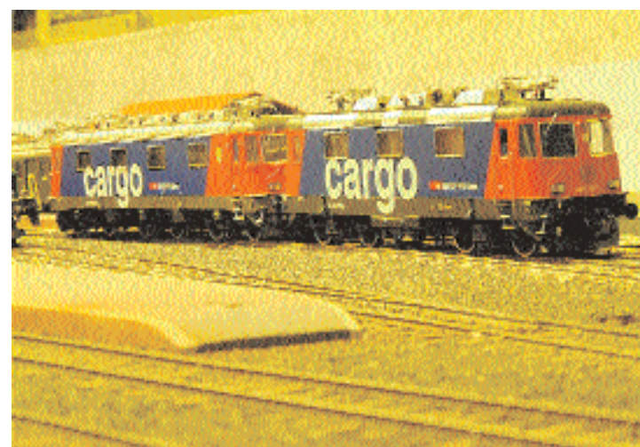
Ce week-end, le CCMB réserve quelques belles surprises au public qui se déplacera au local, à Mâche. (Villars)

Ce week-end, le Club de chemins de fer miniatures de Bienne qui possède son local sur l'aire de la gare de triage à Mâche (accès près du restaurant Mettfeld) ouvre toutes grandes ses portes au public, samedi et dimanche de 10 h à midi, puis de 13 h 30 à 17 h. Le club dispose de deux maquettes, l'une pour le réseau H0 et l'autre pour le 0. Sur ces deux maquettes, plus de 30 trains peuvent circuler simultanément en commande manuelle ou automatique. Cette année, au foyer du club, c'est le Rail Club Pierre-Pertuis, présidé par Marcel Henzi, qui se présente avec une maquette mobile, une occasion de découvrir ce club. (rev)