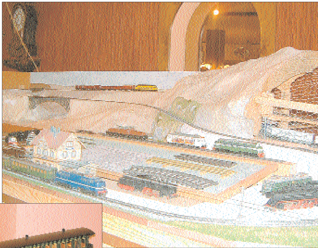
Une partie du circuit de 4 x 2 m, le premier travail collectif exécuté par les membres du club depuis sa fondation, le 27 avril 2000.

Le Rail Club, fondé il y a trois ans, qui compte une trentaine de membres provenant de tout le Jura bernois, a invité le public à sa première exposition le week-end dernier à Bévilard. Elle a connu un beau succès. De nombreux initiés ou curieux sont venus admirer les maquettes.