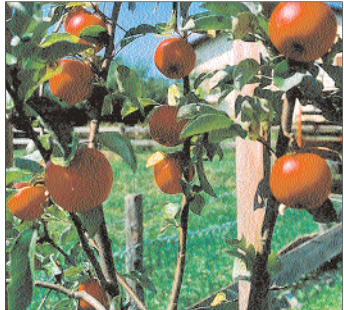
Primes-rouges belles et bonnes à croquer

Dès lors, la conduite de l'assemblée a été reprise par le nouveau président nommé. Le procès-verbal de la dernière assemblée a été lu et approuvé, de même qu'ont été acceptés les comptes de l'année écoulée. Les admissions sont au nombre