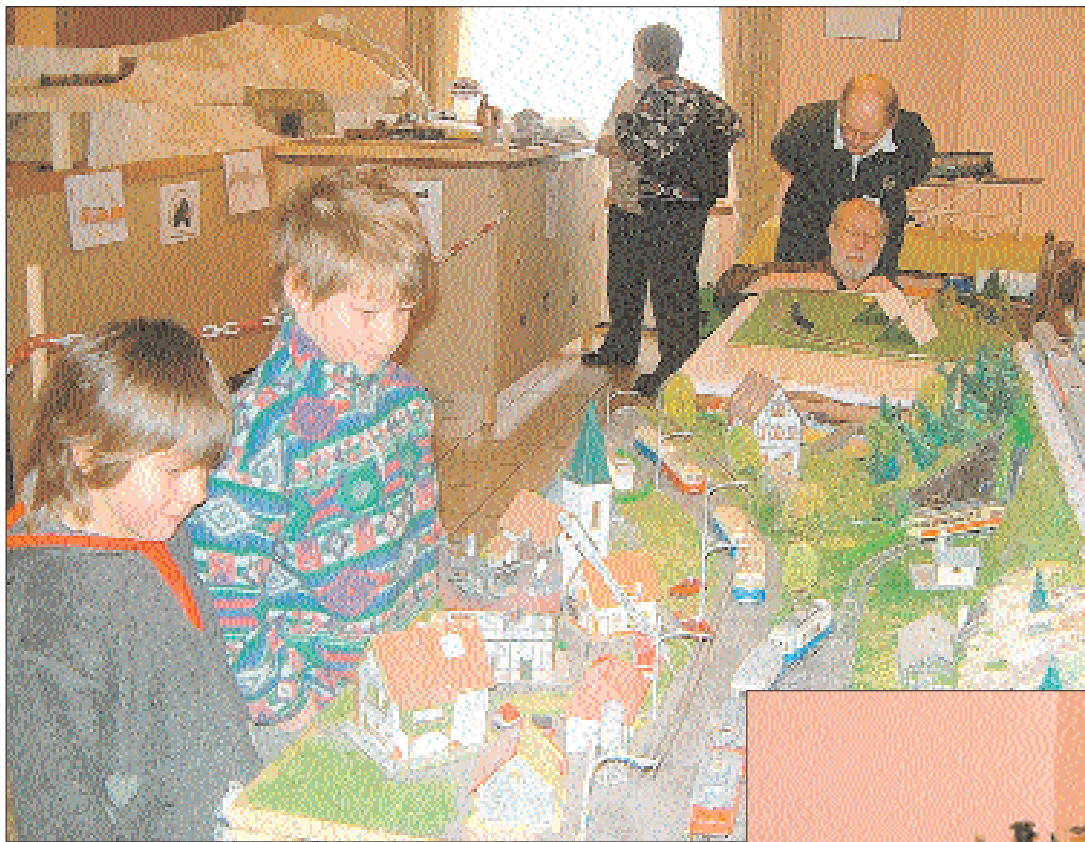
Un petit train qui serpente dans un paysage de rêve, entre maisons, église et château, a particulièrement intéressé les enfants.