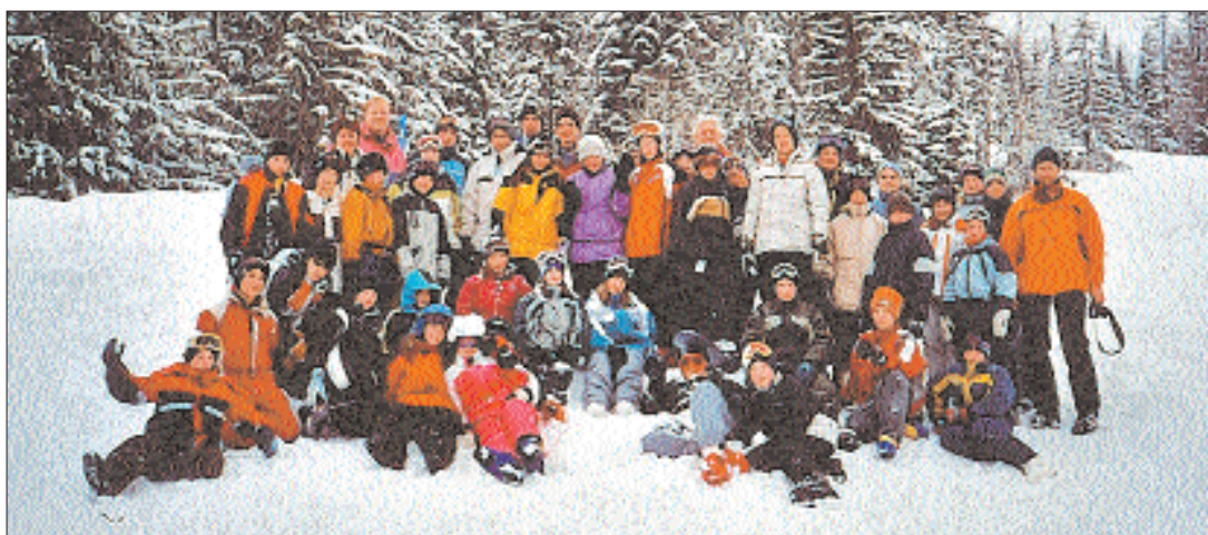
Un salut joyeux d'une équipe enthousiaste sur les champs de neige de Saanenmöser. (ltd)

Enfants et adultes sont rentrés enchantés de leur séjour hivernal. Est-ce les installations confortables du chalet idéalement situé au bas des pistes, la qualité de la nourriture, l'ambiance générale? Dans tous les cas, les accompagnateurs se réjouissent, s'ils en ont la possibilité, de renouveler l'expérience. (rs)