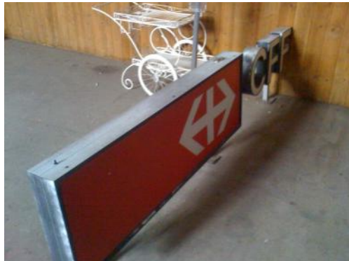
Panneau CFF de la gare de Tavannes